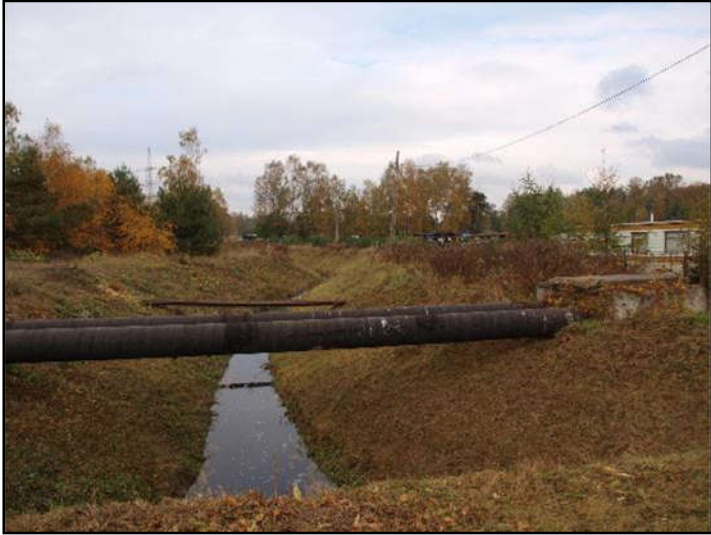
Fot. 1 Imielinka, widok z ul. L. Teligi w kierunku zachodnim