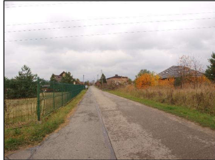
Fot. 8 Ul. Wandy w południowej części obszaru