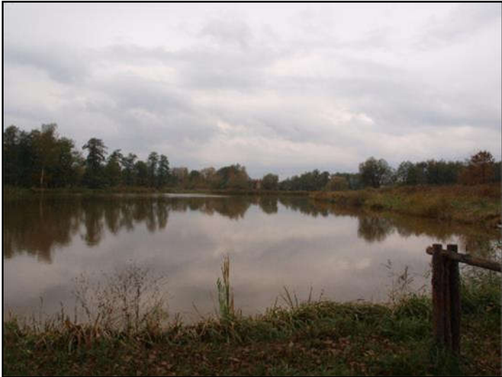
Fot. 14 Staw w dolinie Imielinki, widok z ul. W. Sikorskiego