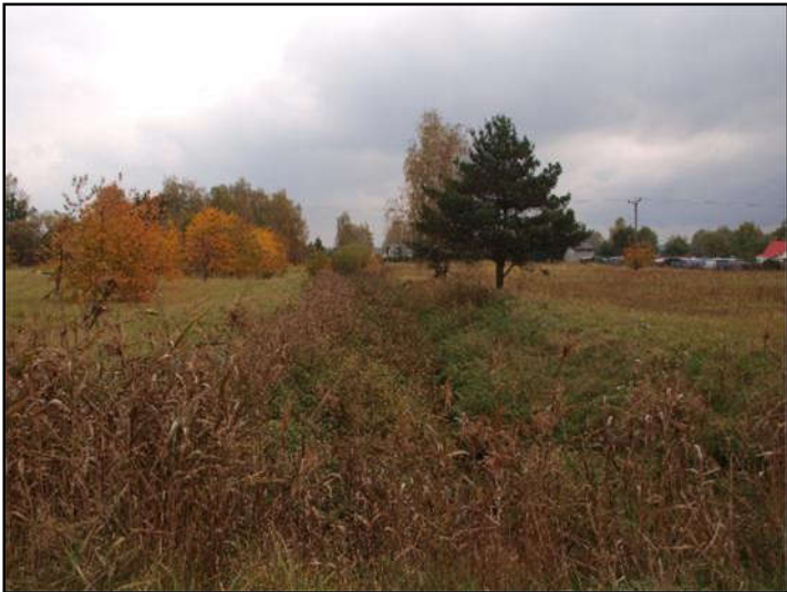
Fot. 2 Imielinka, widok z ul. L. Teligi w kierunku wschodnim