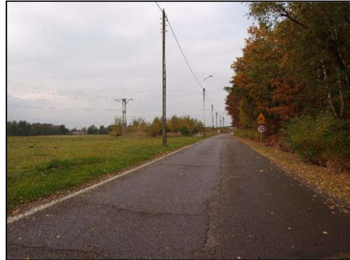
Fot. 4 Ul. Wandy, południowo-wschodnia część obszaru