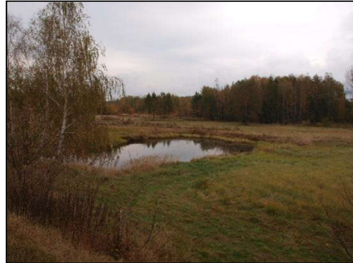
Fot. 12 Niewielki staw położony tuż poza północno-wschodnią granicą opracowania