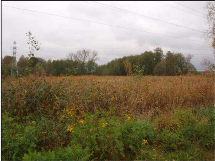
Fot. 6 Trzciniowa w dolinie Imielinki, w obrębie stawu pozbawionego wody