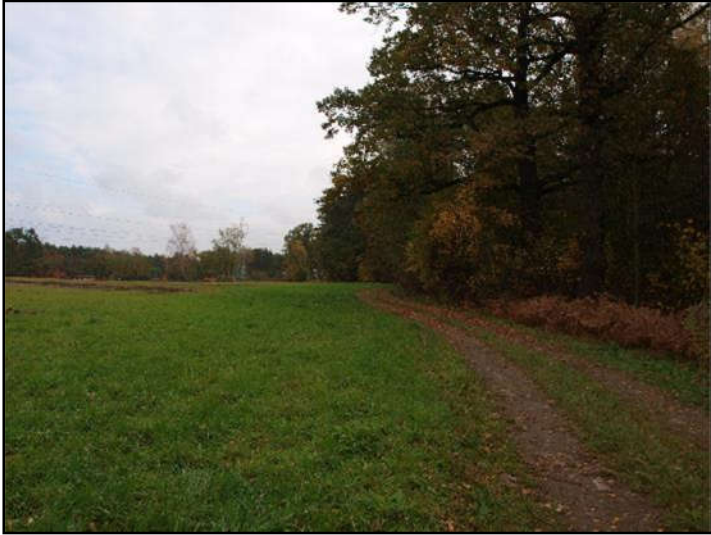
Fot. 5 Zadrzewienia w dolinie Imielinki