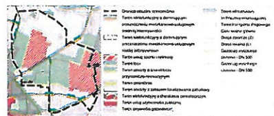
Wyrys ze Studium uwarunkowań i kierunków zagospodarowania przestrzennego miasta Imielin. Uchwała XXVIII/154/2016 Rady Miasta Imielin z dnia 26 października 2016r.

RYСУNEK PLANU, ZAŁ. NR 1 DO UCHWAŁY NR .../.../2019 RADY MIASTA IMIELIN Z DNIA ..... 2019R.