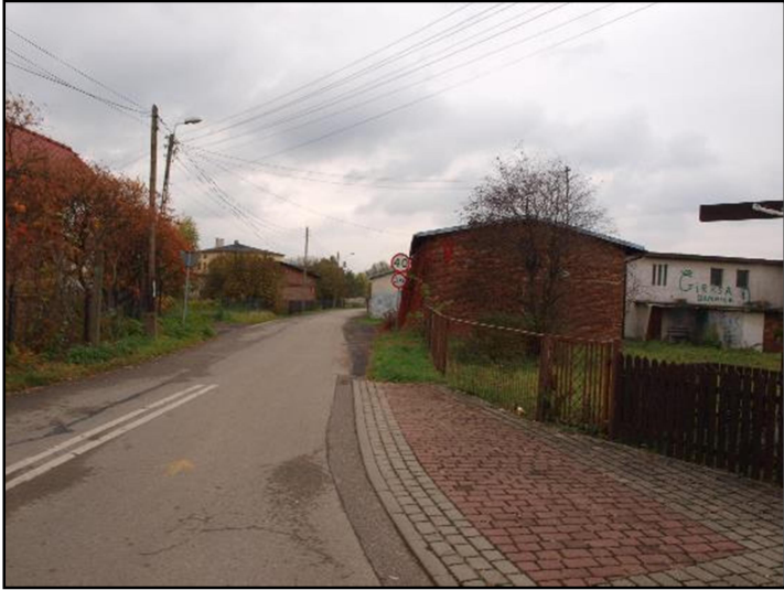
Fot. 13 Zabudowa przy ul. Wandy, północno-zachodnia część obszaru