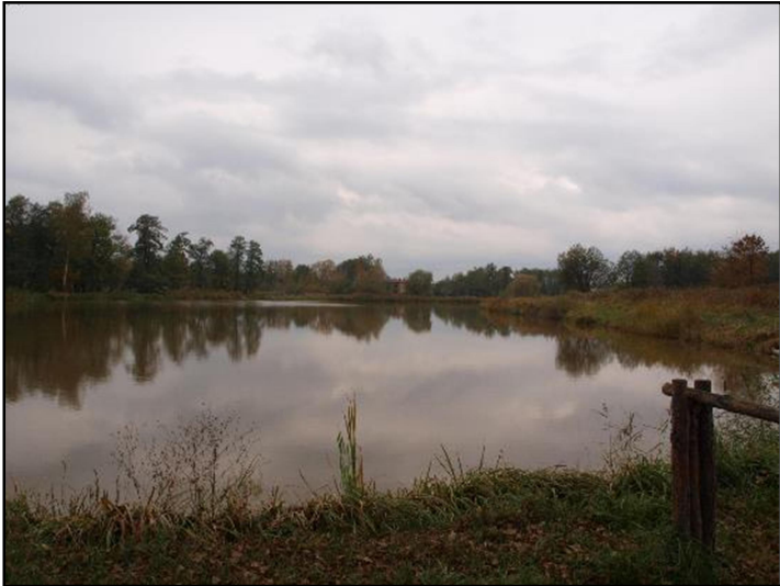
Fot. 14 Staw w dolinie Imielinki, widok z ul. W. Sikorskiego