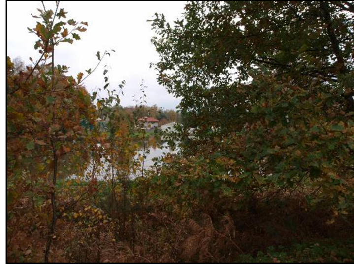
Fot. 7 Staw w dolinie Imielinki pomiędzy ul. Wandy i ul. Podłuże