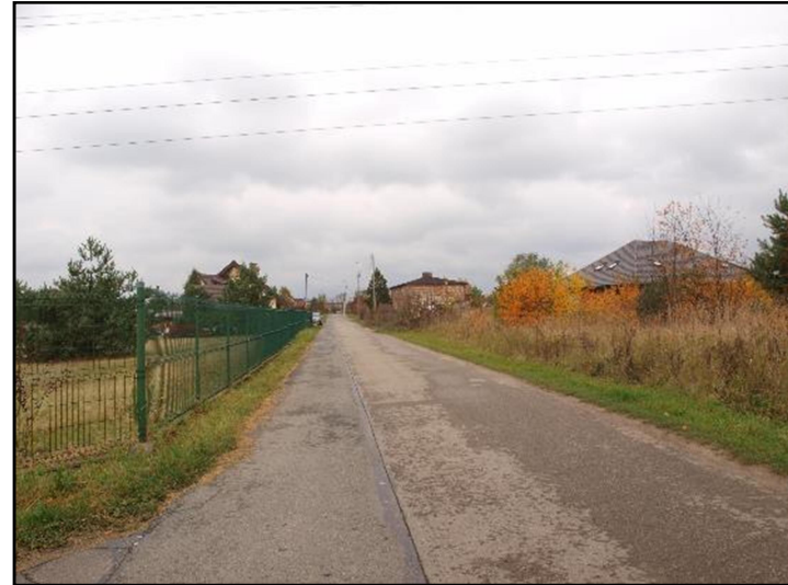
Fot. 8 Ul. Wandy w południowej części obszaru