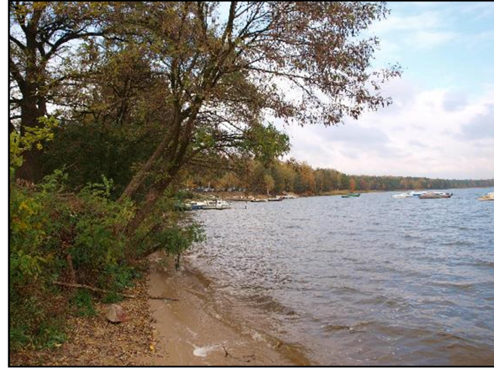
Fot. 3 Brzeg Zbiornika Imielińskiego