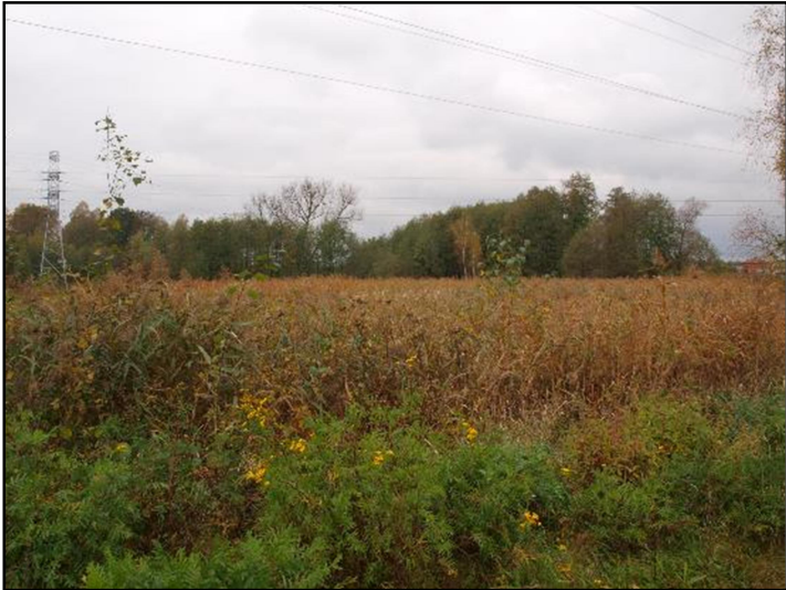
Fot. 6 Trzciniowa w dolinie Imielinki, w obrębie stawu pozbawionego wody