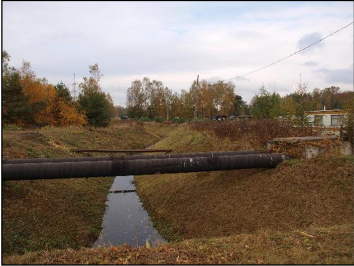
Fot. 1 Imielinka, widok z ul. L. Teligi w kierunku zachodnim