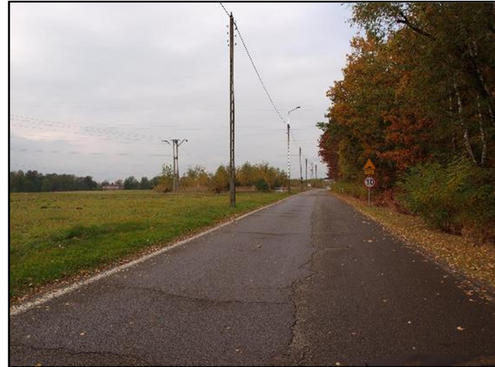
Fot. 4 Ul. Wandy, południowo-wschodnia część obszaru