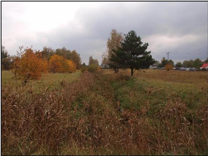
Fot. 2 Imielinka, widok z ul. L. Teligi w kierunku wschodnim