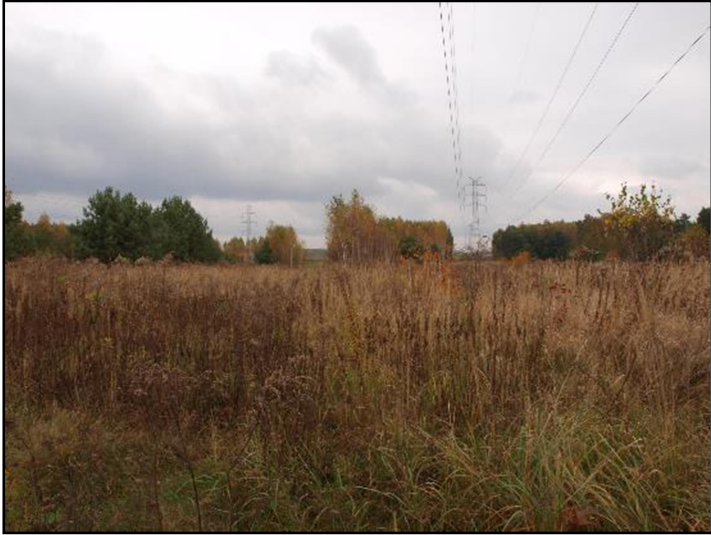
Fot. 9 Ruderalne nieużytki pod liniami wysokiego napięcia we wschodniej części obszaru