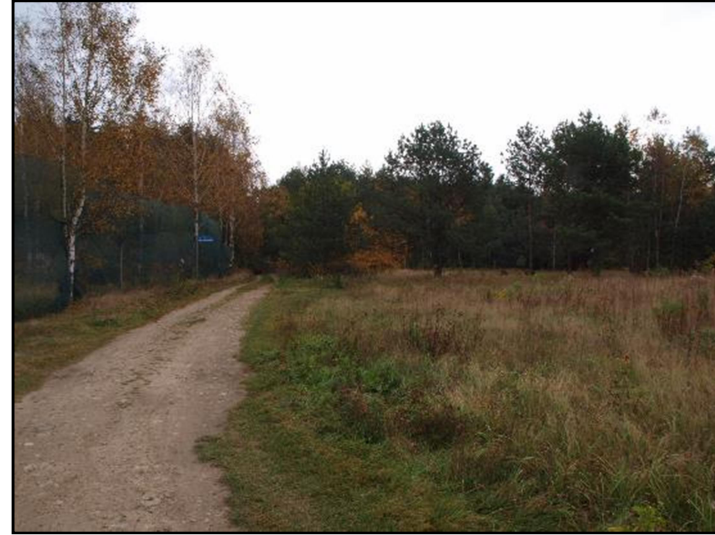
Fot. 11 Wschodnia część ul. Bartniczej, widok w kierunku wschodnim na las sosnowy