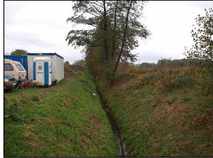
Fot. 15 Imielinka, widok z ul. J. Malczewskiego w kierunku północnym