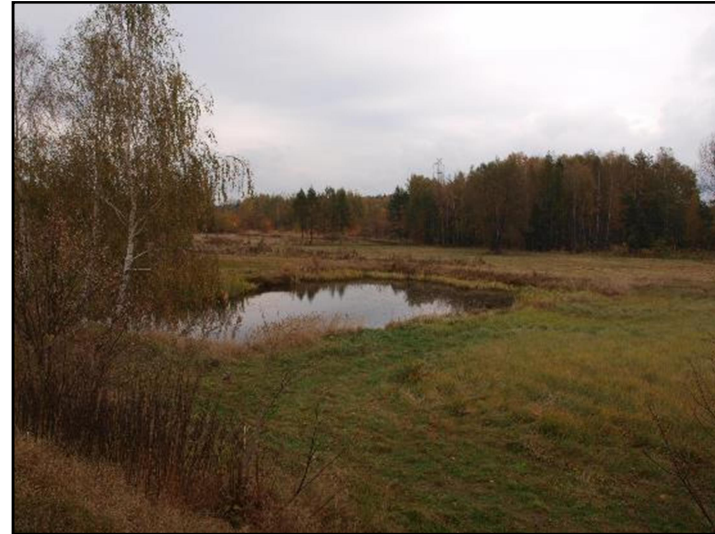
Fot. 12 Niewielki staw położony tuż poza północno-wschodnią granicą opracowania