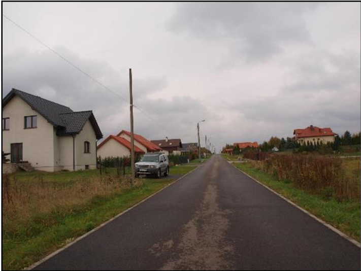
Fot. 10 Ul. Bartnicza w północno-wschodniej części obszaru