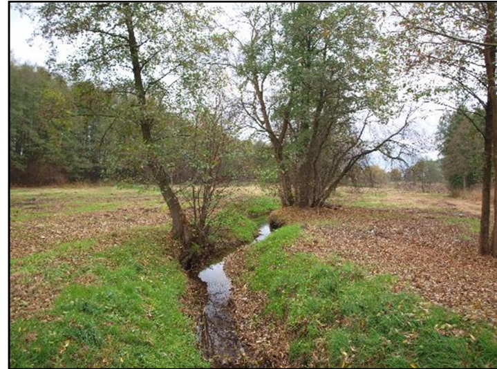
Fot. 16 Imielinka, widok z ul. J. Malczewskiego w kierunku południowym