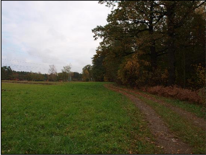
Fot. 5 Zadrzewienia w dolinie Imielinki