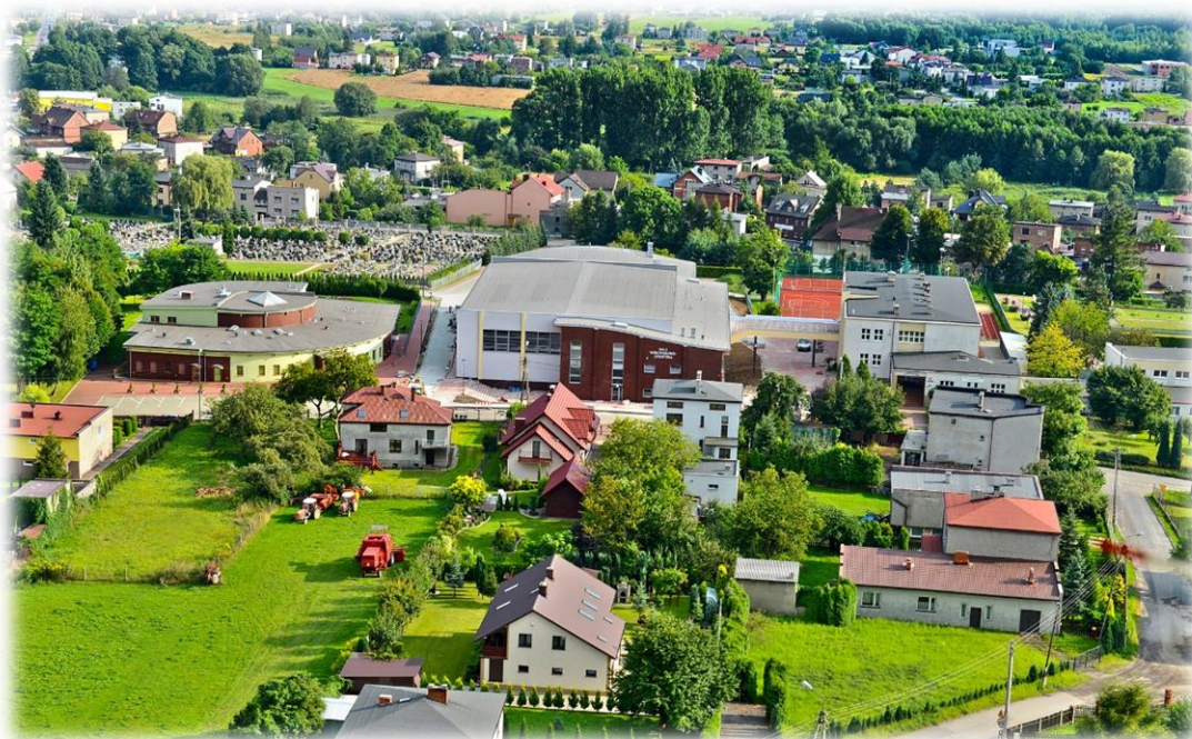
Zdjęcie 1. Hala widowiskowo-sportowa z lotu ptaka.

Poglądowe zdjęcia przedstawiające wolne lokale użytkowe.