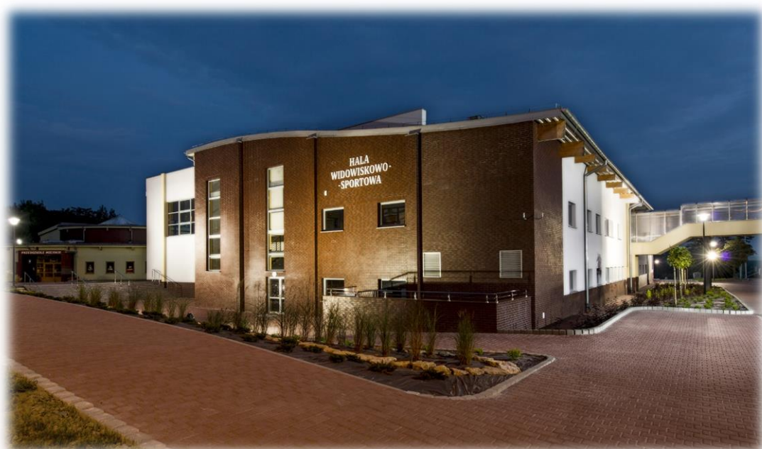
Zdjęcie 2. Wejście do części rehabilitacyjnej (od ulicy Sapety).