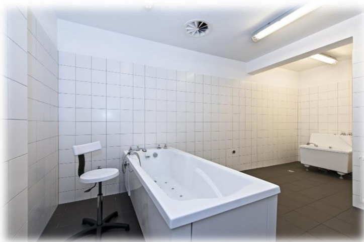
Zdjęcie 3. Sala hydromasażu nr 1.