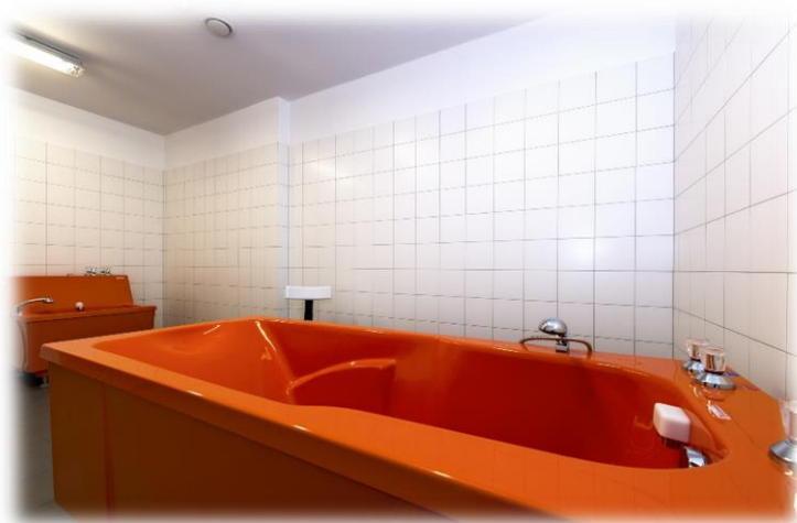
Zdjęcie 4. Sala hydromasażu nr 2.