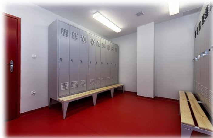
Zdjęcie 5. Szatnia