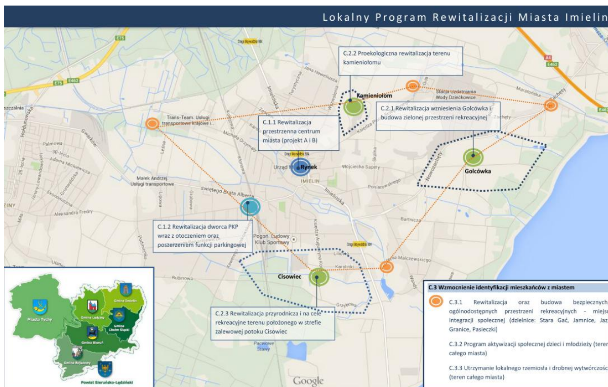
Rysunek 1. Rozmieszczenie projektów rewitalizacyjnych.

Lokalny Program Rewitalizacji obejmuje swoim zasięgiem cały obszar miasta Imielina, a główne planowane projekty rewitalizacyjne rozmieszczone są w różnych obszarach miasta (rysunek 1), dlatego też analizie stanu środowiska poddano cały obszar miasta Imielina.