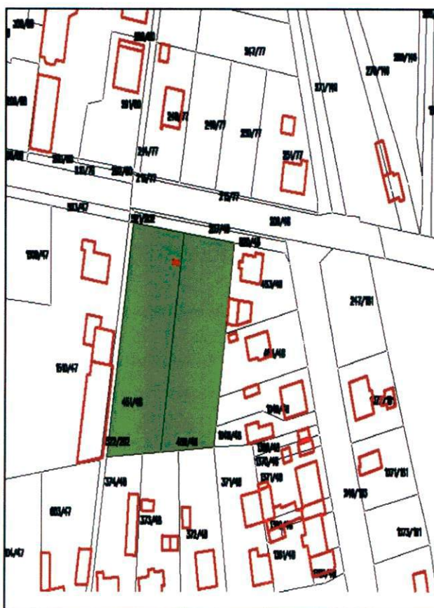
Dzierżawa części działek przy ul. Św. Brata Alberta